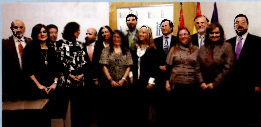
Representación de los premiados y los miembros de la Mesa Presidencial, acompañados por el secretario general de Política Social y Consumo, el vicepresidente de FIAPAS, el vicepresidente del Jurado, la directora y la gerente de FIAPAS y el conductor del Acto.